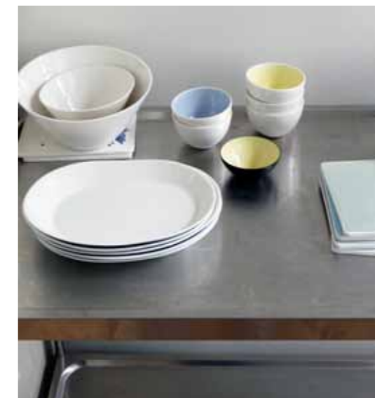
Kjøkkenet ligger innerst i boligen, mot gården. Til kjøkkenbenken valgte de å bruke Andshufl ( andshufl.com ) som lager fine fronter og bordplater trukket med linoleum og tilpasset Ikea-moduler. Armaturene er fra Toni, kjøleskap og komfyr er fra Smeg. Hengepottene med planter, kopper og vaser er Anne Blacks eget design.