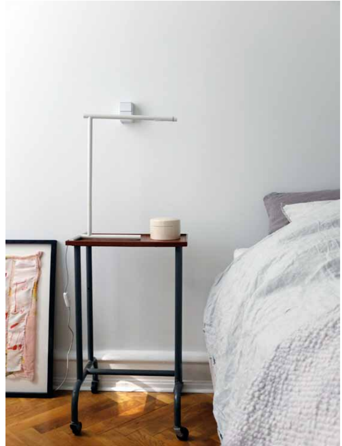
Soverommet ligger stille og svalt inn mot gården. Bordlampen er designet av Cecilie Manz for Lightyears. Stolen er Wegners skallstol (CH07 fra Carl Hansen), sengebordet er et loppefunn og bildet er gjort av Astrid Svangren.